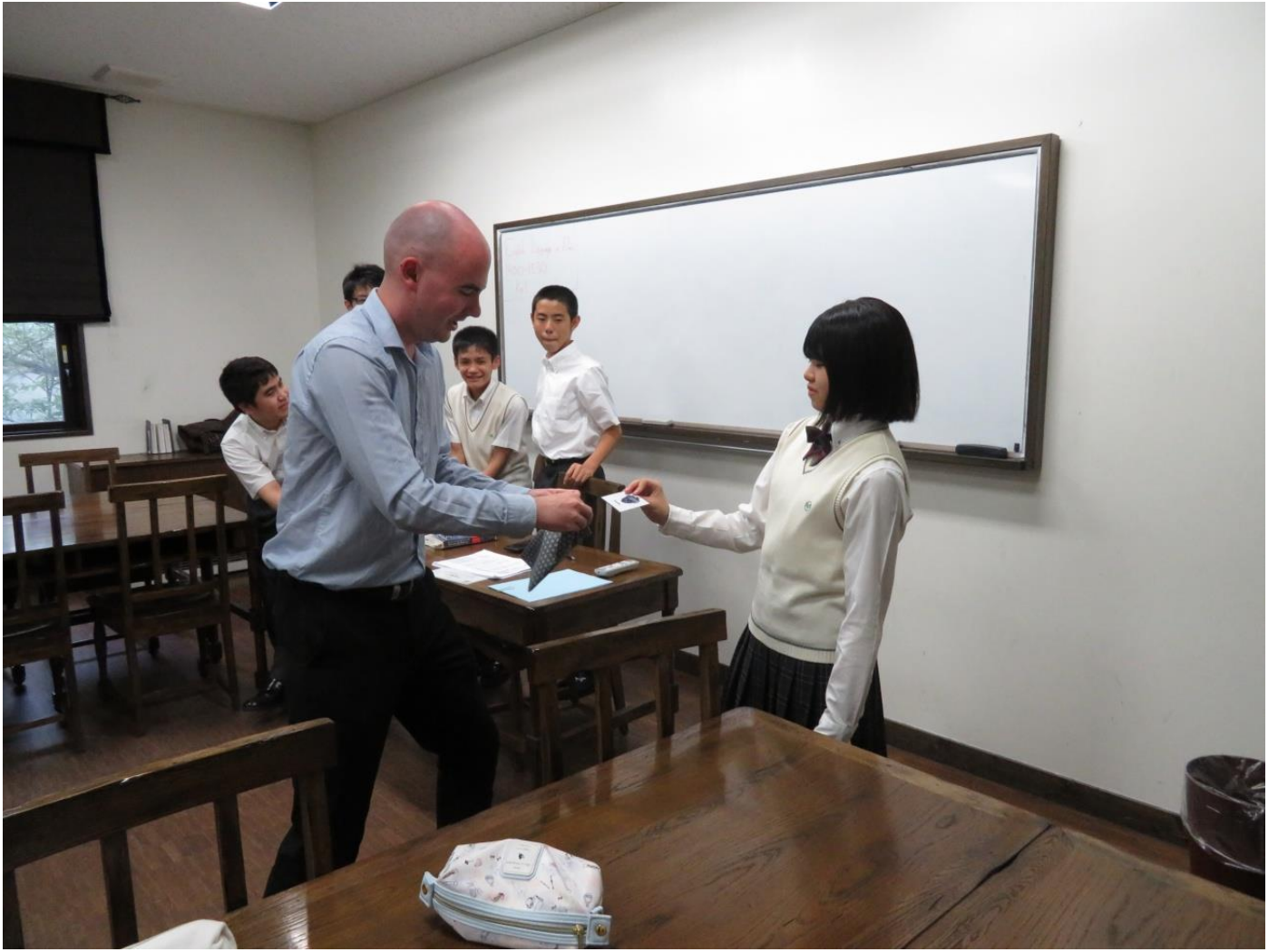
ホテルのフロントでブリティッシュヒルズポンドに両替です。