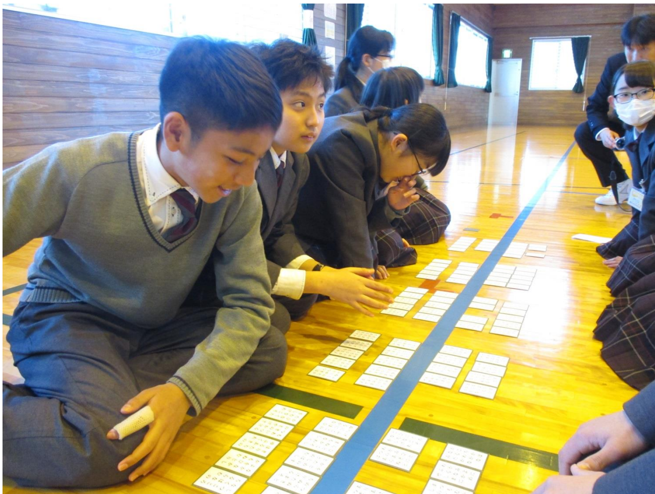
審判も生徒たちが行います。