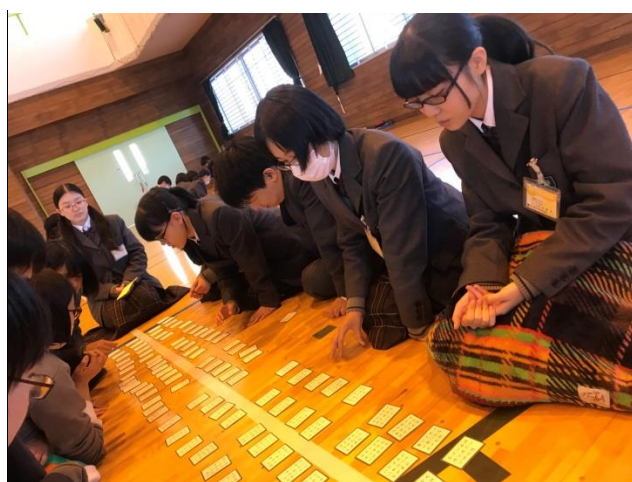
各チームとも決まり字を覚えており、上の句で札を取り合うレベルの高い試合となりました。