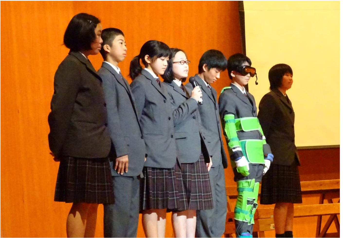
3年生が制作した「Junior High School Musical」のミュージックビデオは圧巻でした。